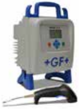
GEORG FISCHER +GF+