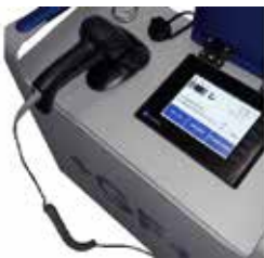
GEORG FISCHER +GF+