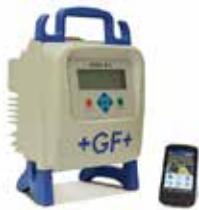
GEORG FISCHER +GF+